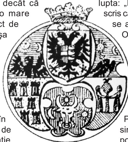
Stema lui Sigismund Báthory (1597)

Deși o prezintă drept o victorie turcească, cronica lasă să se înțeleagă că angajarea luptei a luat prin surprindere armata otomană, care a suferit pierderi grele, printre care mai mulți comandanți de mare rang.