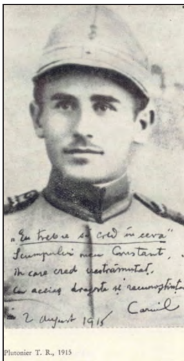
Plutonier T. R., 1915

El ține acum un adevărat „jurnal de front”, multe dintre notații constituind materialul de viață prezent în romanul „Ultima noapte de dragoste, întâia noapte de război”. Când începe războiul (1916), Camil Petrescu este plutonier