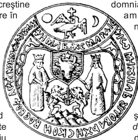
Stema lui Mihai Viteazul

Primul dintre aceștia este Giovanni Battista Castaldo (1493-1563), faimos condottier italian,