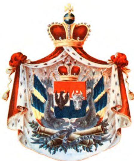
Stema Principatelor Unite din 1859

Înfăptuirea unirii de bază a pavat drumul spre obținerea independenței și desăvârșirii Marii Uniri. Fără unirea din 1859 ar fi fost imposibilă crearea statului național unitar, eveniment cardinal din devenirea istorică a românității. În afară de condițiile externe favorabile în realizarea actului unirii, românitatea a avut nevoie de o elită politică tenace și responsabilă, animată de sentimente patriotice și dotată cu dexterități diplomatice. Țările mici nu și pot asuma inițierea unor demersuri politice cu reverberații continentale, precum cele ce vizează trasee ale granițelor naționale, de aceea ele trebuie