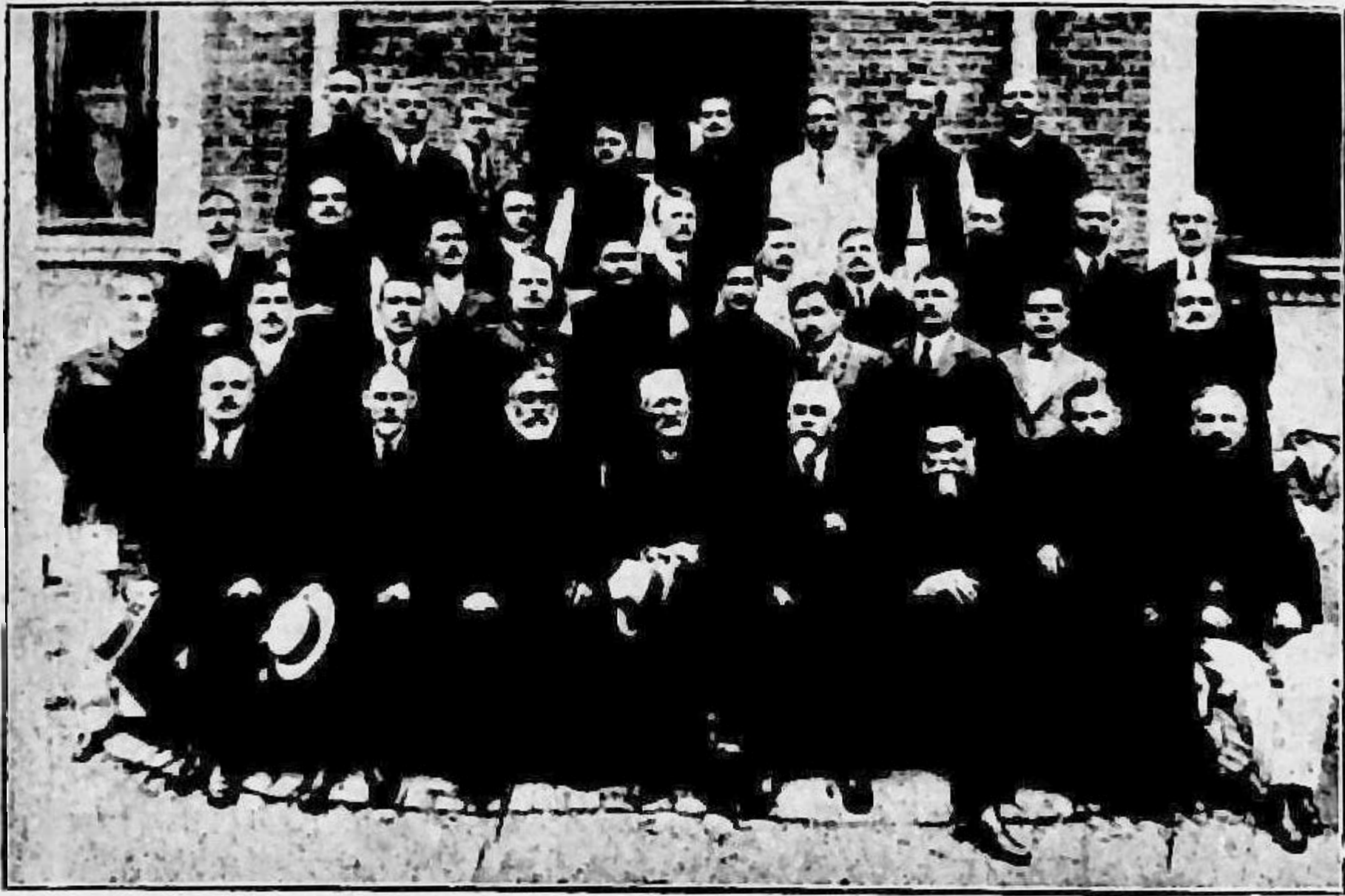
după 25 ani

„cunoștinței, să înălțăm o rugă către Dumnezeu pentru grija lor, și să chemăm sufletul lor lângă al nostru. Să chemăm totodată și sufletul acelor profesori și colegi ai noștri care nici ei nu sunt aci, pe pământ și să refacem sufletește viața noastră de familie de acum 35—40 ani.