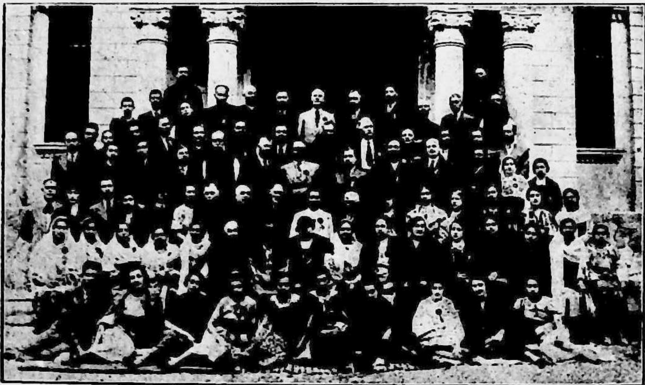
după 35 ani

....Nu-mi pot închipui un dascăl mai intuitiv,