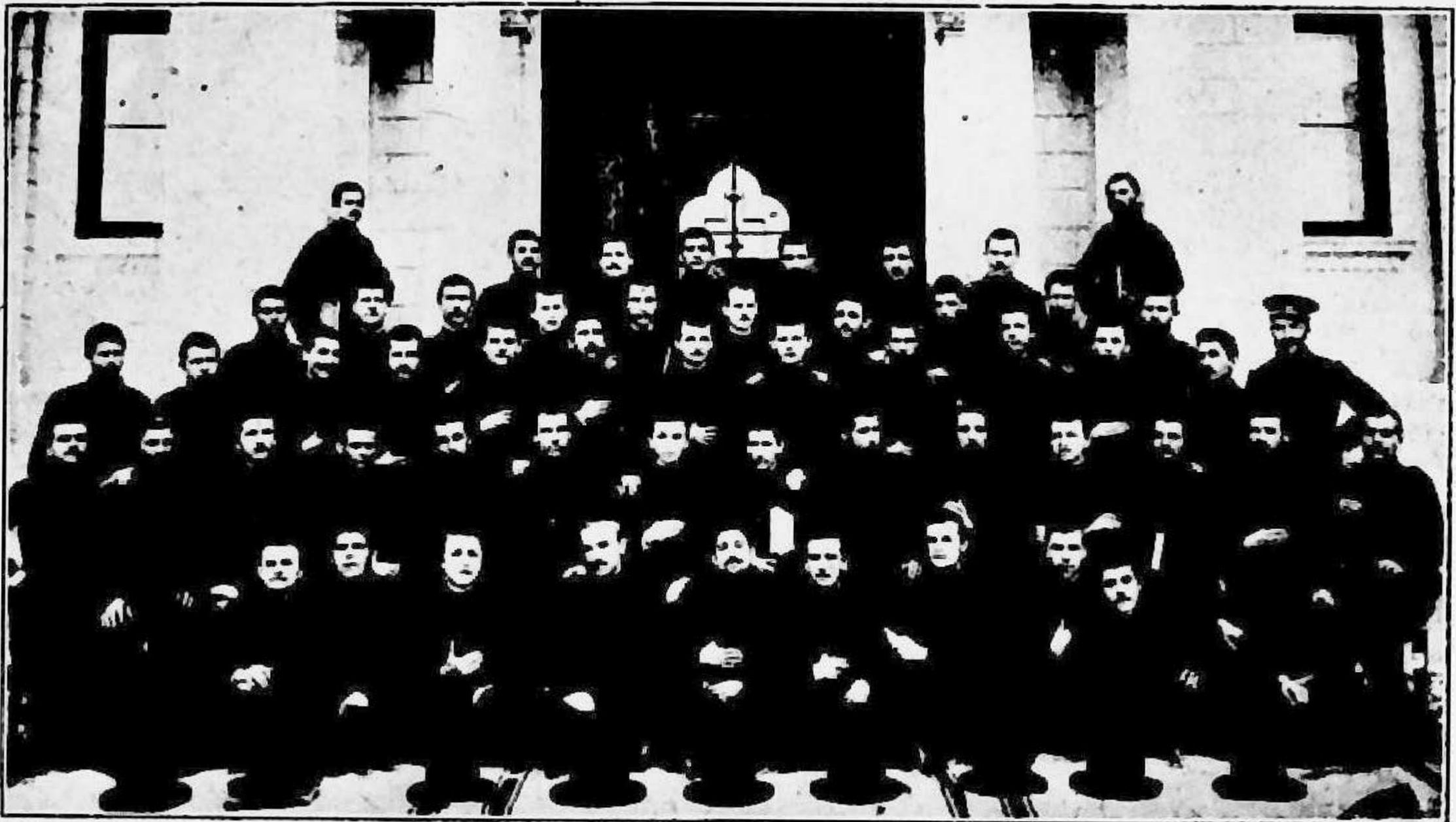
28 Iunie, 1901

Cu acest prilej care incheia capitoul recule-