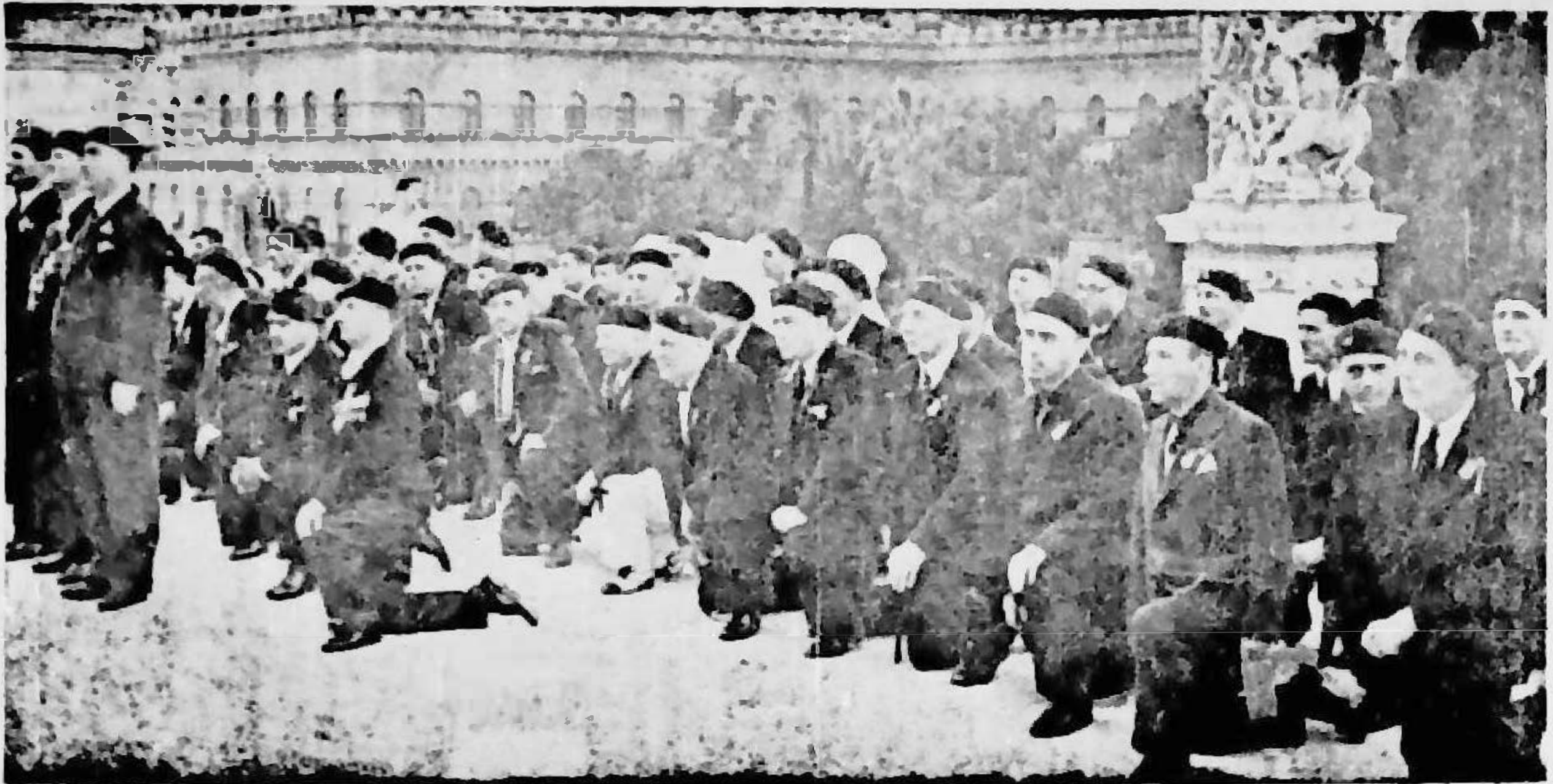
OMAGIUL EROULUI NECUNOSCUȚ DIN ROMA

REVISTA CORPULUI DIDACTIC PRIMAR DIN JUDEȚUL DÂMBOVIȚA — SUB AUSPICIILE ASOCIAȚIEI JUDEȚENE — A P A R E L U N A R