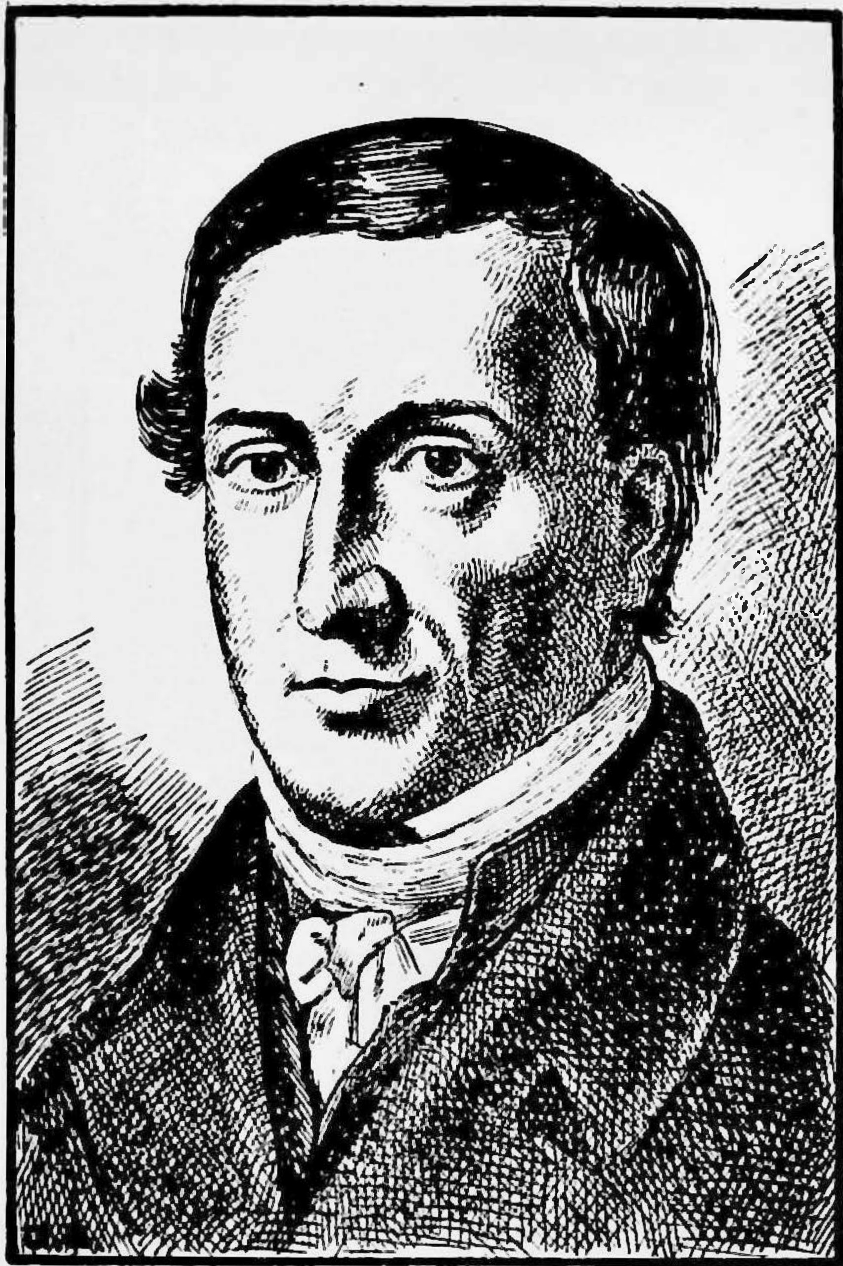
IOHANN-FRIEDRICH HERBART 1776—1841

Metafizician, psiholog și pedagog german. Autorul treptelor formale. El întemeiază pedagogia pe etică și psihologie și formulează principiul învățământului educativ (educația prin instrucție).