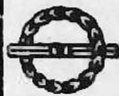
Pecetea oraşului Târgovişte depe scrisoarea judeţului Mitrea şi a celor 12 pârğari către judeţul Lucaci şi cei 12 pârğari ai oraşului Braşov din anul 1530.