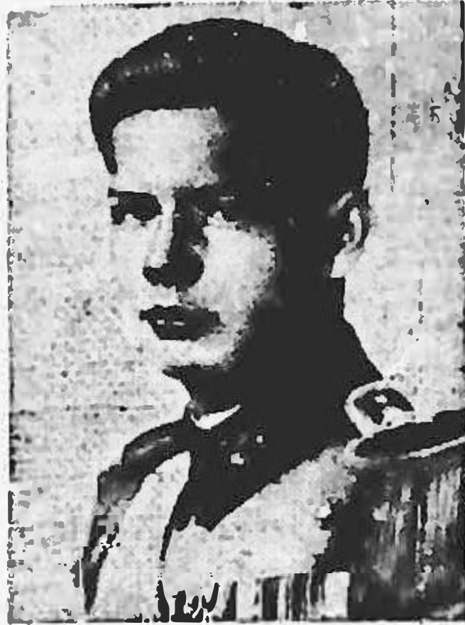
M. S. REGELE MIHAI I